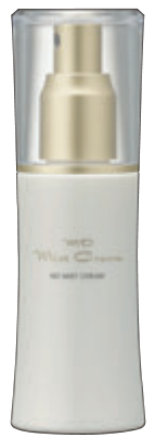
エムディ ミストクリーム 80ml ¥6,300(税抜)

つい、自分のお手入れを忘れがち。(クリームでゆっくりマッサージしている暇がない・・・)とお嘆きの方にオススメです!